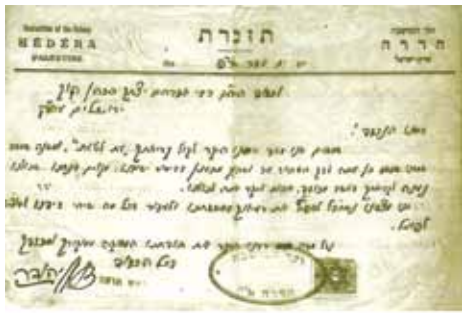
אנשי חדרה מוקירים את קריאת הרב לנטוע בארץ.

לידי רוממות החיים... ובקיימנו אותם עכשיו, הננו מעשירים את נשמת אומתנו" כתב. עם התרחבותו של הישוב והגידול בפירות, נוצרו פרצות במערכת קיום המצוות התלויות בארץ. נתברר שהעניין טעון חיזוק. המצב הכלכלי הקשה לא איפשר העסקת מספיק משגיחים בתשלום, גם קשיי התחבורה לא הקלו על הפקוח. רבני ירושלים ובראשם הרב שמואל סלנט והרב חיים ברלין שרשטותיהם היו פרושות על הנעשה