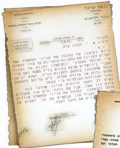
ההסכמה לפשרה עליה חתמו יצחק בן צבי, וי"ד "הועד הלאומי"

שניהם גילו מסירות רבה כדי להוכיח את אכזריותם של הפורעים הערביים בחברון ואת אשמתם. הערבים אף התלוננו שהיהודים זכו לפרקליטים מהשורה הראשונה של משפטני אנגליה. חברי הסוכנות היהודית הדריכו אותם לנקוט בקו מתון ולא לדרוש בעלות על הכותל לעומת עמדתו החד משמעית והנחרצת של הרב קוק.