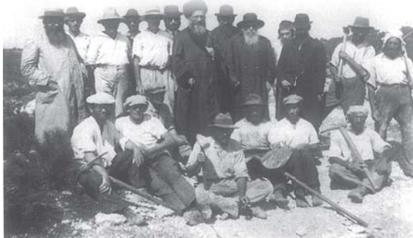
עם חלוצי "עבודת ישראל" תרפ"ז

הג"ל כמובן שהעניין על דבר הקני' צריך להיות בסוד גדול.