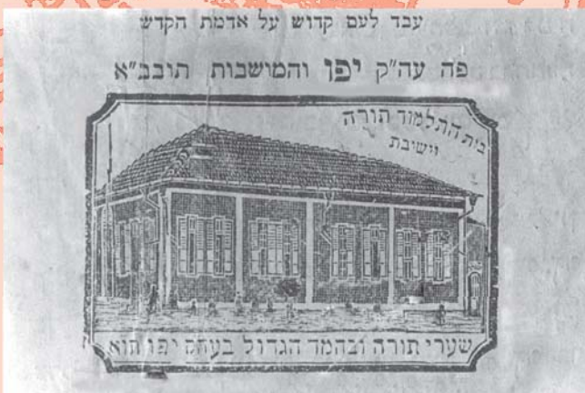
לפרטים נוספים ניתן לפנות למרכז התיעודי ב"בית הרב"

מתוך כרוזי הראי"ה ליקט וערך: יוחנן מ. ישמח ז"ל