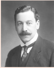
הנציב העליון הרברט סמואל

ניסן תרפ"ג אדוין סמואל, בנו של הנציב העליון הרברט סמואל, מבקש את רשימת שעות כניסת השבת בירושלים ויציאתה, עבור הוד מעלתה - הגברת סמואל.