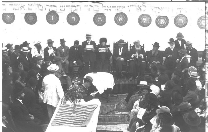
טכס חנוכת "בית הרב" במוכחות הארי פישל

הרב שאר ישוב כהן הרב הראשי לחיפה ת"ו נשיא מוסדות "אריאל"