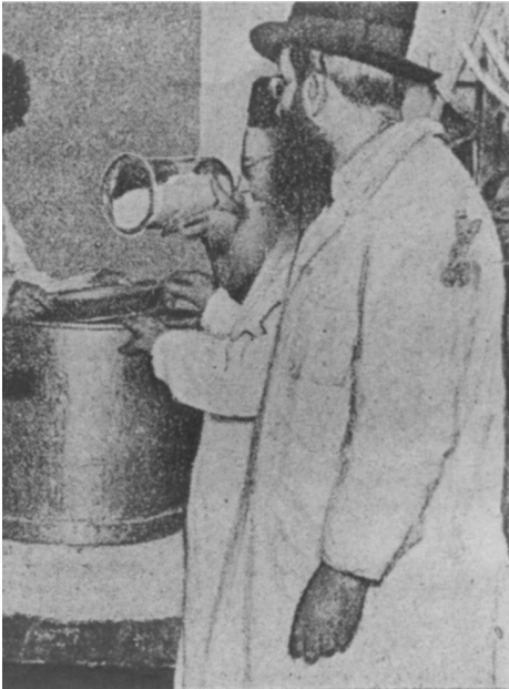
מרן הרב בשעת אפיית מצה שמורה בביקורו בארה"ב, תרפ"ד

דבר עצמי כלל, כי עדיין על ישראל המעלה הזאת שהם בני חורין בעצם, עם שעבוד במקרה... (שם). המהר"ל מבחין בין המהות לבין התופעות המקריות. ביציאת מצרים הוגדרה מהותנו - מהות של בני חורין. מהות זו נקבעה בנפשנו, ומאז ועד עתה יש לנו תודעה פנימית של בני חורין, שכל הגלויות לא יכלו לעקור. מכוח אותה חירות פנימית, החזקנו מעמד בגלות הארוכה, לא התייאשנו, לא ויתרנו, לא נשברנו, אלא ייחלנו לגאולה, לקיבוץ גלויות, לבני ירושלים ולצמח דוד. ועל כן הצלחנו לשרוד אלפי שנות גלות, לחלוף על פניהן ולשוב לציון. מהות זו גם נחרתה בדפי ההיסטוריה, של עם ישראל. ביציאת מצרים, הקב"ה הקנה לעם ישראל את "הטוב בעצם" עד שהיו ראויים להיות בני חורין מצד עצם מעלתם. ההנהגה האלוהית את ההיסטוריה, העניקה לנו ביציאת מצרים את החירות הלאומית וסופה להוביל אותנו אליה. אמור מעתה כי הגלויות הן "מקרה", משברים חולפים, נפילות זמניות. דינה של הגלות הוא ככל מקרה - סופה לחלוף ולעבור. כדרך שכותב המהר"ל בפרק הראשון של ספרו "נצח ישראל": "הגלות בעצמה היא ראייה והוכחה ברורה על הגאולה". מדוע? מכיון שהגלות היא חריגה מהסדר הראוי - עם ישראל עצמאי בארצו - וכל חריגה מהסדר לא תתמיד, מפני שהטבע לא משתנה. ומתי כל זה נקבע? מתי נקבע ה"טבע" הזה? ביציאת מצרים; לכן, גאולת מצרים איננה עבר נוסטלגי, שנמחק על ידי יציאתנו לגלות אלא הווה חי ופועל, שדוחף אותנו אל הגאולה, אל החירות הרוחנית והלאומית המלאה. בעת שאנו מסבים לשולחן הסדר ועוסקים ביציאת מצרים, איננו משתתפים בזיכרון אירוע מהעבר הרחוק שתהפכות היסטוריות רוקנו אותו מכל תוכן, אלא מצויים אנו בתוכו של אירוע אקטואלי הממשיך להשפיע עלינו, על נפשנו ועל ההיסטוריה שלנו העכשווית.